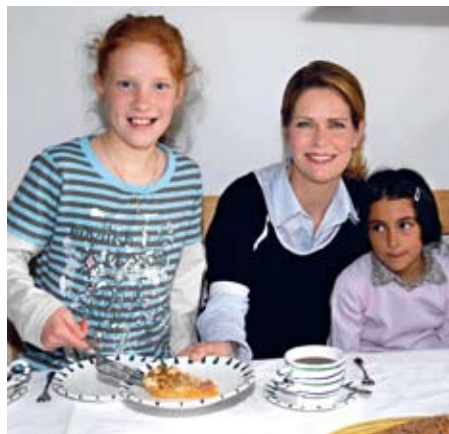
Beim Besuch im SOS-Kinderdorf Ammersee wurde die Schauspielerin offen aufgenommen.

„Meine Wahrnehmung hat sich verändert, seit ich selbst Mutter geworden bin. Man trägt große Verantwortung. Es ist wichtig, einem Kind das Bestmögliche zu vermitteln, damit es später sein eigenes Leben gut meistern kann. Ich versuche, trotz meines Berufs viel Freiraum für das Zusammensein mit