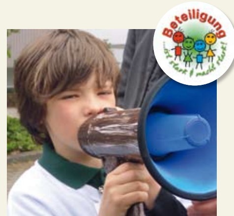
Hier hatten die Kinder das Wort. Vielfältig, kunterbunt und lebhaft ging es bei der ersten deutschen SOS-Kinderkonferenz zu.

Mitte Mai trafen sich im SOS-Kinderdorf Lippe rund 200 Kinder und Jugendliche zur dreitägigen SOS-Kinderkonferenz. Diese stand für die Teilnehmenden aus SOS-Einrichtungen in ganz Deutschland im Zeichen engagierten und kreativen Mitmachens: „Beteiligung ist stark und macht stark“ lautete das Konferenzmotto. In zahlreichen Workshops setzten die Kinder und Jugendlichen sich mit den Themen Kinderrechte und Beteiligung auseinander. Dabei kam der Spaß nicht zu kurz. Im selbst errichteten Klettergarten erlebten Mutige, wie wichtig es ist, einander zu vertrauen, miteinander zu kommunizieren und sich zu helfen. Im Musik- und Hip-Hop-Workshop wurde schnell klar: Im Takt bleibt die Gruppe nur, wenn alle genau zuhören und Rücksicht nehmen. Der SOS-Kinderdorf e.V. betrachtet es als zentralen Baustein seiner Pädagogik, Kinder und Jugendliche zu beteiligen. 2007 verabschiedete die Geschäftsleitung hierzu eine Leitlinie für die Mitarbeiterinnen und Mitarbeiter in den SOS-Einrichtungen.