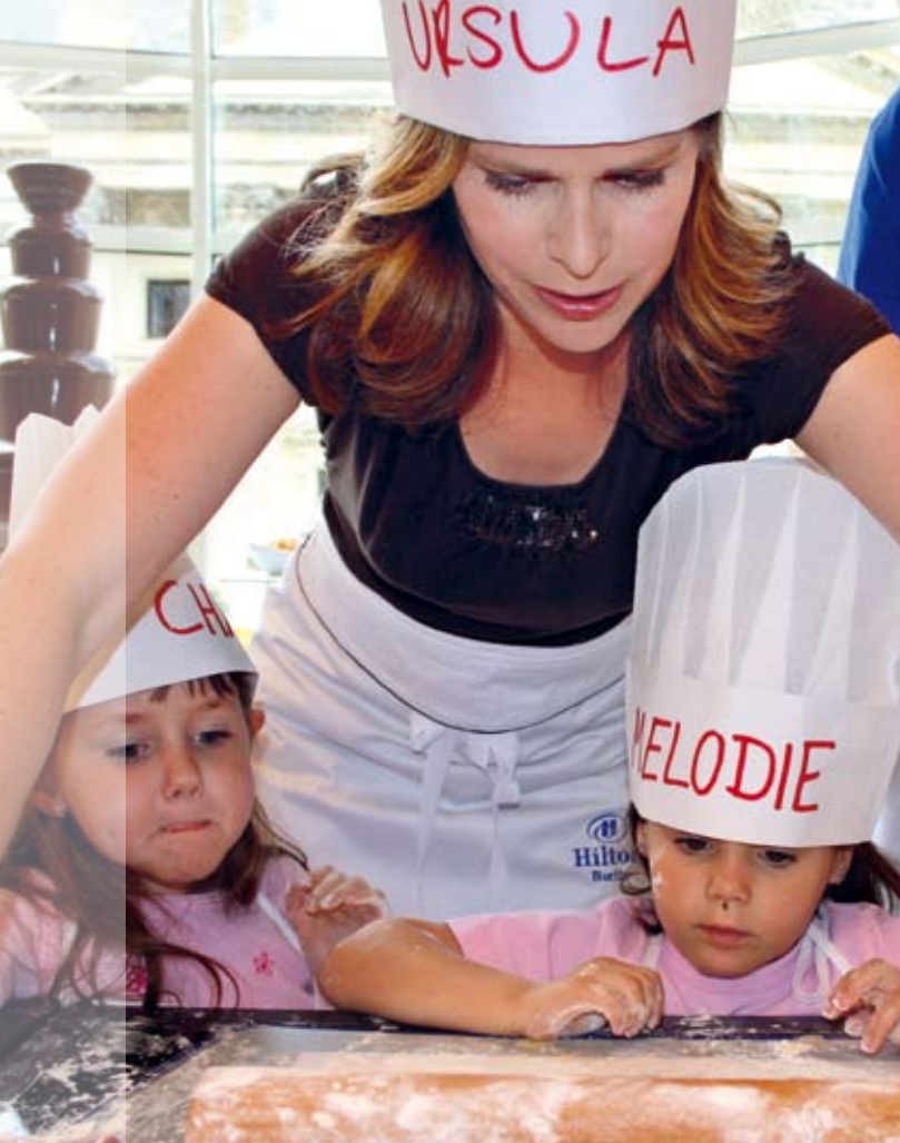
Beim Muttertagsbacken im Berliner Hilton machte Buschhorn mindestens so begeistert mit wie die Kinder aus der Tagesbetreuung des SOS-Familienzentrums Hellersdorf.

meiner Tochter zu schaffen. Wir genießen es beide, wenn wir wie hier im Urlaub uneingeschränkt Zeit füreinander haben. Ich kann aber auch nachvollziehen, wie schwer gerade die ersten Jahre allein mit Kind sein können, da ich selbst in dieser Zeit alleinerziehend war. Und dass sich Mütter überfordert fühlen können. Meine Eltern waren zum Glück immer da für mich und haben mir sehr geholfen. Ich komme aus einer stabilen Familie. Das ist mit ein Grund, warum ich mich freue, als SOS-Botschafterin einen kleinen Beitrag leisten zu können.“