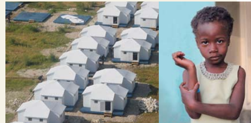
SOS-Kinderdorf verteilt Lebensmittel in Zeltlagern, wo viele Kinder leben. Auch der Aufbau von Notunterkünften geht weiter.